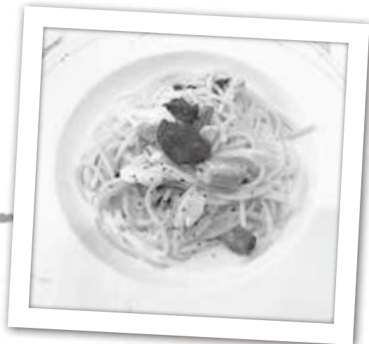
音更町産ほうれん草と十勝池田町産玉葱入りクリームスパゲティー