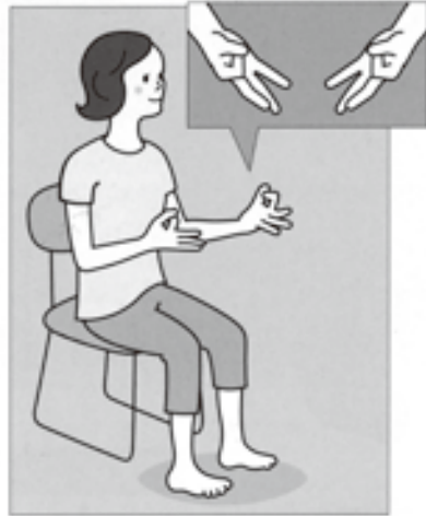
(2) 人さし指の第1関節を曲げ、親指で人さし指の爪を押さえます。このとき、足の指はグーの形に曲げます。(1)と(2)を「1、2、1、2……」と声に出しながら交互に20秒間繰り返します。