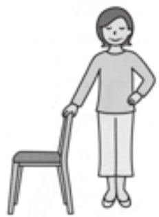
(3) (1)の姿勢に戻ります。いったん、ひと息つきましょ！