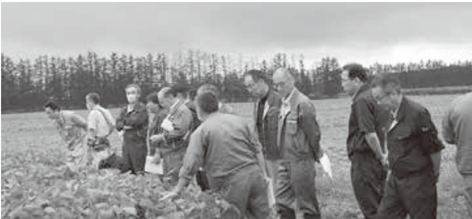
大豆の生育状況の確認