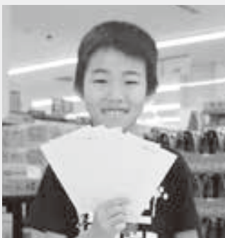
〈今月の抽選者は私です〉