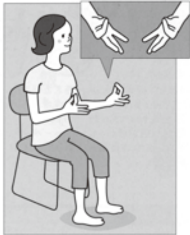
(1) いすに座り、足を肩幅程度に開きます。両手の親指と人さし指の腹を合わせます。このとき、足の指は何もしません。