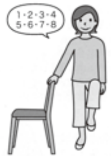
(2) 片脚を引き上げてバランスを取ります。