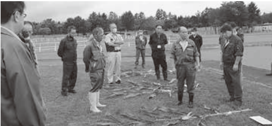
飼料用とうもろこしの生育状況確認