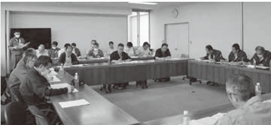
とりまとめ会議の様子

9月11日に町内関係機関による合同作況調査が実施されました。今回の合同作況では、4年振り関係者全員で町内一円をバスで巡回し、収穫期を迎える大豆や小豆の圃場、収穫ピークを迎えているデントコーンの生育状況について現地を確認しました。