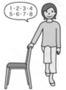
(4) もう一方の脚を引き上げてバランスを取ります。その後、(1)の姿勢に戻ります。