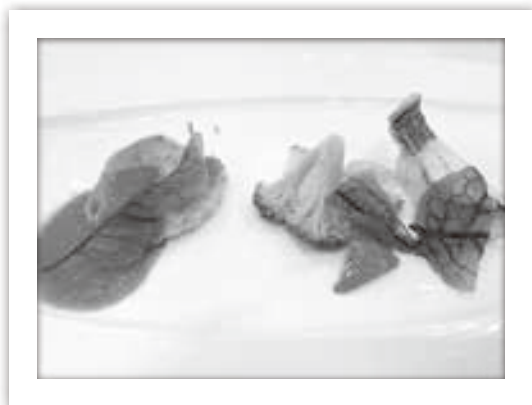
(左から)ミラノ風チキンカツレツ トマトソース 帯広川西産長いもと十勝清水町産ブロッコリーを添えて 白身魚のソテー白ワインソース