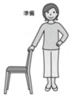
(1) いすの背もたれを軽く持ち、準備をします。