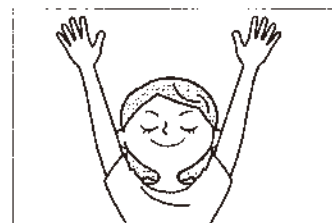
(4) 腕を上へ伸ばして指先を開きます。(1)～(4)の動きを繰り返します。

ポイント 動かすときには反動はつけない、「イチ、ニ、イチ、ニ」と声に出しながら行うとリフレッシュにもなりおススメです。