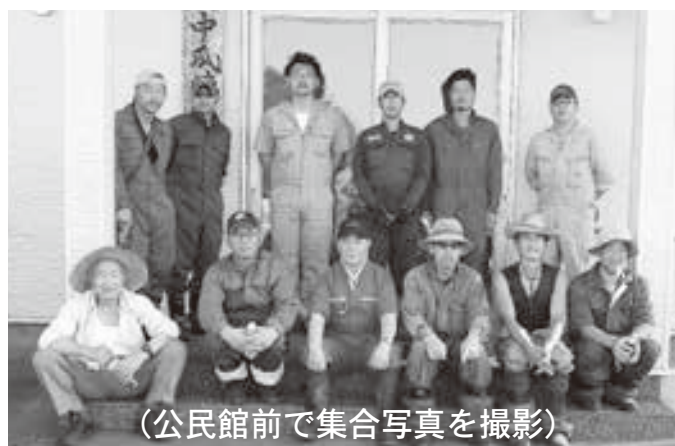
(公民館前で集合写真を撮影)