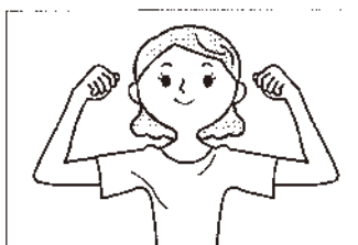
(3) 両肩の位置に戻して両手を握ります。