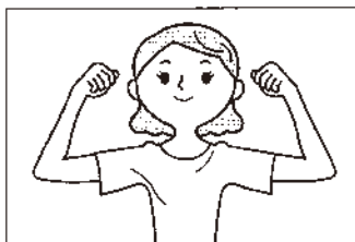
(1) 両肩の位置で両手を握ります。肘を少々後ろに引いて背筋も伸ばします。