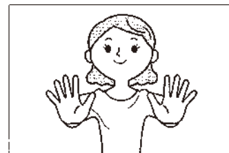
(2) 両腕を前に伸ばし、指先まで元氣よく開きます。