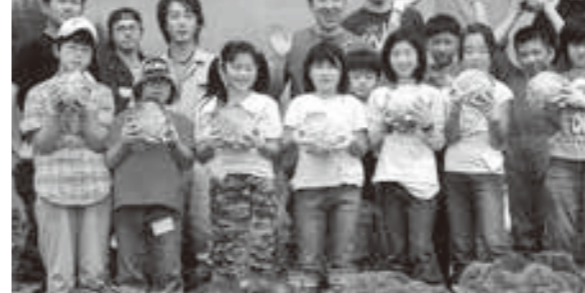
子ども達とキャベツの収穫体験を行いました。(平成18年8月撮影)

は混んとしてはいますが、食は切っても切れない縁です。その中で食の第一人者である事に誇りと責任を持って様々な事にチャレンジして欲しいです。多くの場面でピンチをチャンスに聞こえ、聞かぬ場面がありますが、今がそのピンチの場面だと思えます。皆さんの頑張りに期待しています。