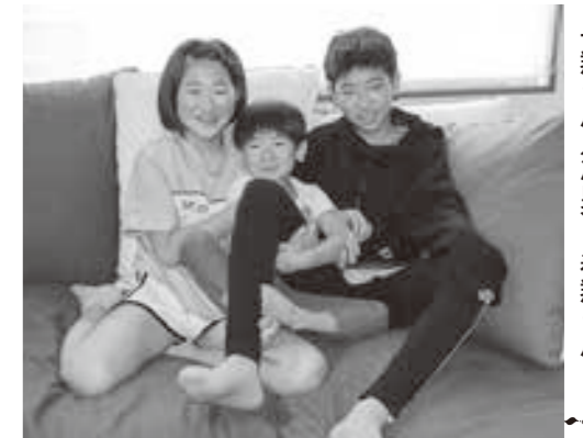
(左から) れみちゃん(長女)、一翔くん(次男)、春翔くん

○心に残る思い出は何ですか? 平成30年の冬に家族全員でハワイに旅行してビーチ等で遊んだ事です。 ○将来の夢は何ですか? 将来は農家かパティシエになりたいです。農家になりたい理由は家族でいつも一緒に過ごせるからです。昨年はキヤベツや長いもの収穫を手伝いお小遣いをもらってとても嬉しかったです。また、パティシエになりたい理由は甘いものが大好きで自分で作りたいと思うからです。