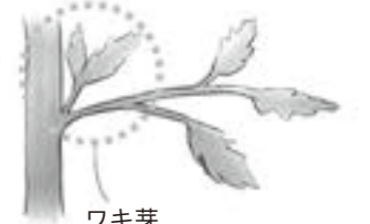
ワキ芽 (葉のつけ根から出る芽)