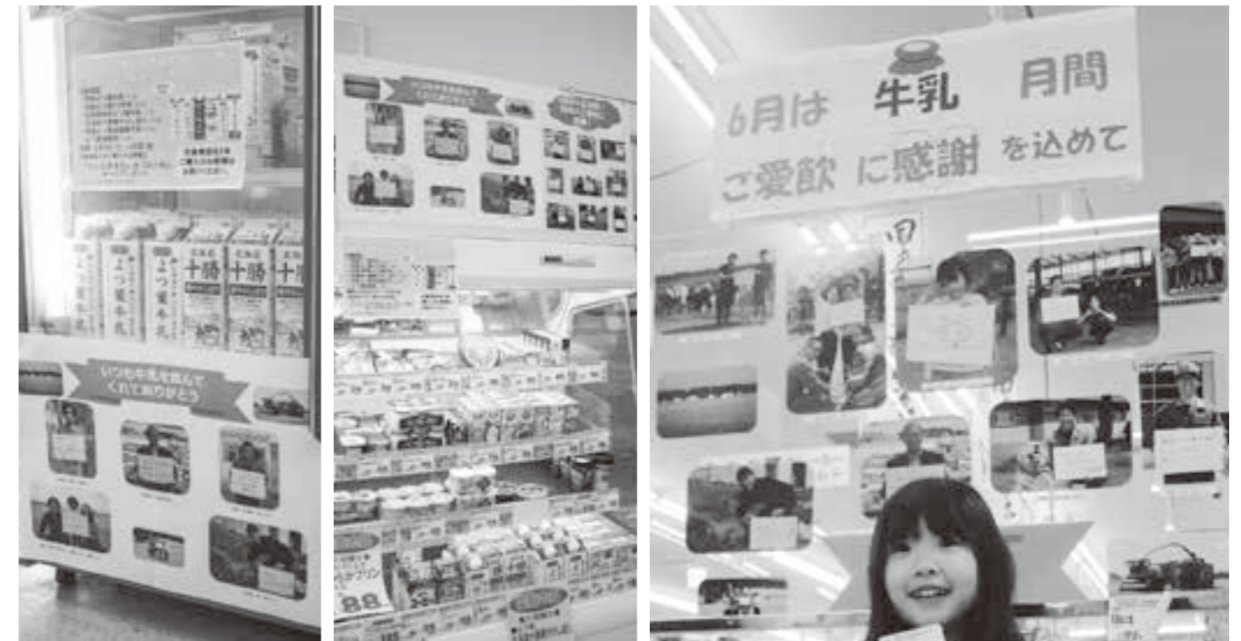
Aコープ東瓜幕店 Aコープ瓜幕店