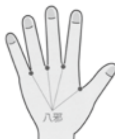
八邪の位置。指の間の水かき部分(手の甲側)にあります。

日本の夏は高温多湿で水分が不足しやすく、その一方で冷たい飲み物の取り過ぎにも気を付けないと、体の水分代謝が悪くなると、むくみや胃腸不良、重だるさなど、すつきりしない症状が出ることも。今回は、八邪(はちじや)というツボを刺激する体操を紹介します。指と指の間にあるツボは両手を合わせて8カ所あり、まとめて八邪と呼ばれます。八邪は東洋医学では気が滞りやすい場所と考えられており、刺激を与えることで代謝や気の巡りを