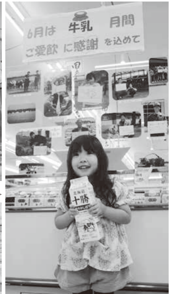
町内の酪農家による感謝の気持ちを込めたメッセージボード Aコープ鹿追店