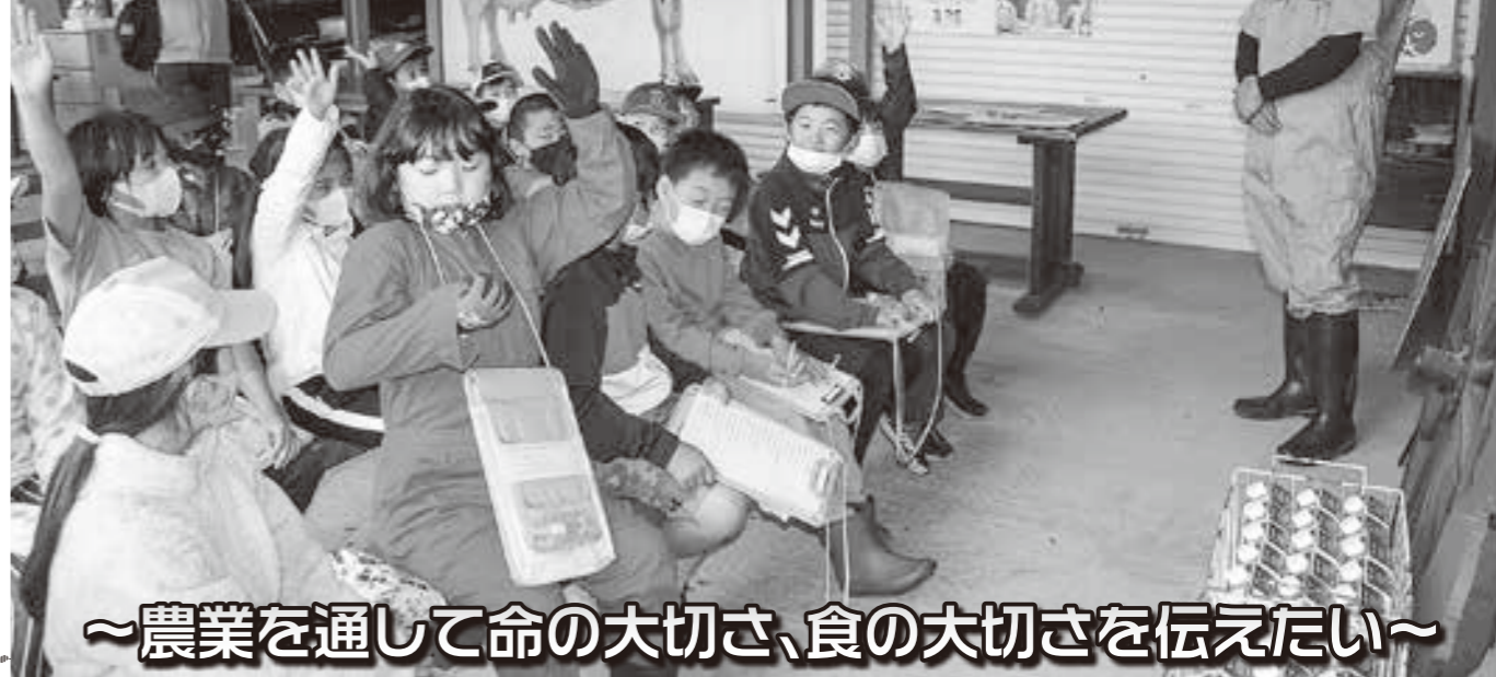
酪農クイズで積極的に手を挙げる子ども達