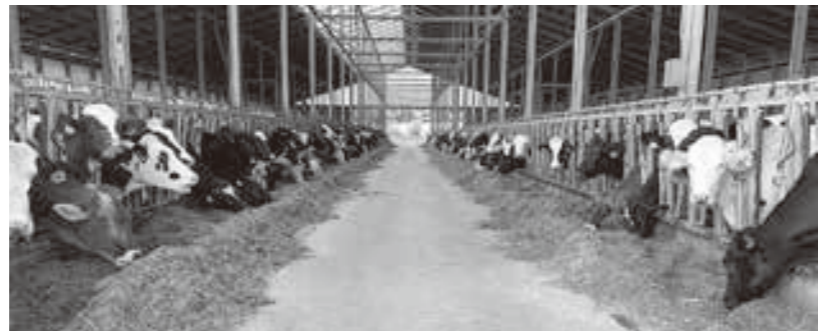
舎飼で採食中の牛たち

冬期舎飼は、10月26日より始まり、全体で1,800頭の受入を行います。冬期についても将来の鹿追町の生乳生産を担う、生産性の高い健康な乳牛の育成に努めて参ります。