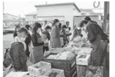
種なし柿や有田みかん等販売