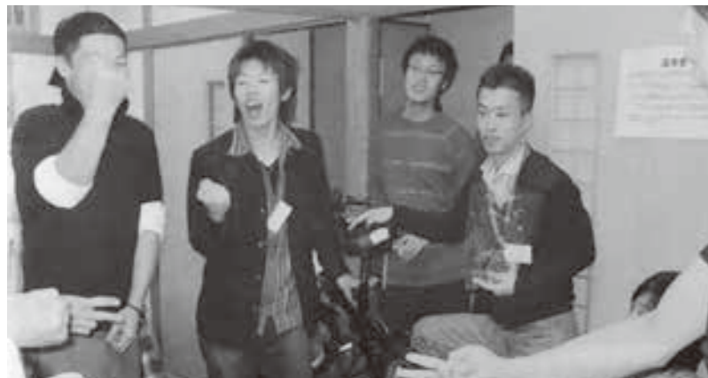
JA青婦部との交流会(平成19年4月撮影) 目玉商品の自転車をかけたじゃんけん大会

との協力は基より、青年部員一人ひとりの役割がとても重要だという認識を深めました。その他、各専門委員学習会、フレッシュミズやJA青婦部との交流会、子ども農業体験等を開催し、知識や技術の向上と部員相互の親睦を深め、地域の子ども達に食の大切さを伝える等、様々な活動を実施しました。