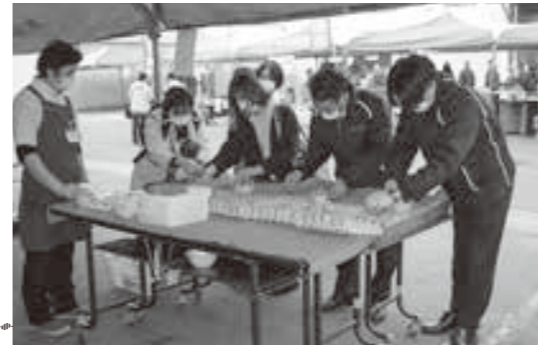
純卵積み上げ放題

毎年恒例の「第37回Aコープ鹿追まつり大感謝市」を10月16日に開催しました。日頃からAコープ店をご利用頂いているお客様に感謝の気持ちを伝える還元セールとして実施しています。が、昨年に引き続き、新型コロナウイルス感染症対策として、1日限りの開催とし、お客様にもマスクの着用等ご協力頂きながら実施致しました。