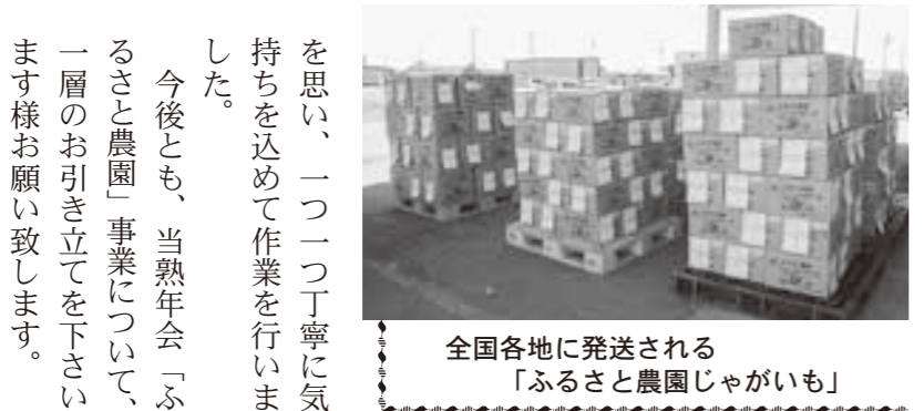
全国各地に発送される「ふるさと農園じゃがいも」

て協議を重ね企画したもので、顔出しパネルには夫婦山をはじめ、鹿追産農畜産物や「くてくう」と手をつなぐ子ども達のイラストが描かれ、観光客や町民の皆さんに「鹿追町農業に理解を深めてもらいたい」「楽しい時間を過ごしてもらいたい」という思いが込められています。