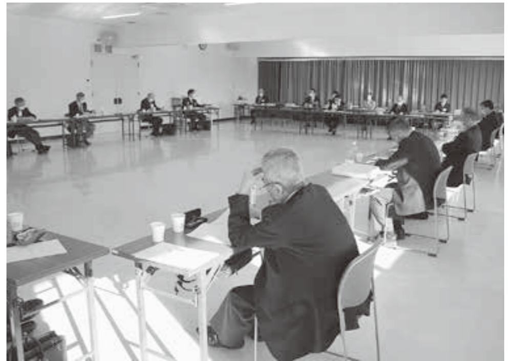
役員からは様々な角度から提言され事業計画を策定しました。

2月4日から7日までの日程で新年度事業計画樹立に向けた事業計画検討部会を開催しました。部会では、地区別懇談会や畑作・酪農技術懇談会等で頂いたご意見を基に各課で検討した新年度事業並びに今年度からスタートする第11次農業振興計画について、重点