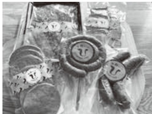
(有)内海ファームの経産牛で作った畜産加工品。牛への感謝の気持ちと今後は多くの消費者に食べて頂きたいという思いで、販売出来る準備を進めています。

○女性がもったいきいきと働く為には何が大切だと思いますか？ 自分の特性や得意な面を活か