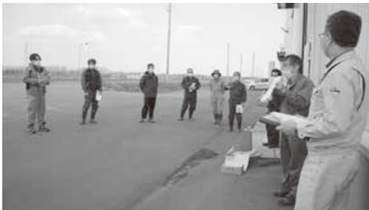
北鹿追・幌内・上幌内地区の懇談

今回は5月中旬頃を予定しており、作物毎の病害虫防除や雑草対策、豆類の播種作業等を中心に計画しておりますので是非ご参加下さい。