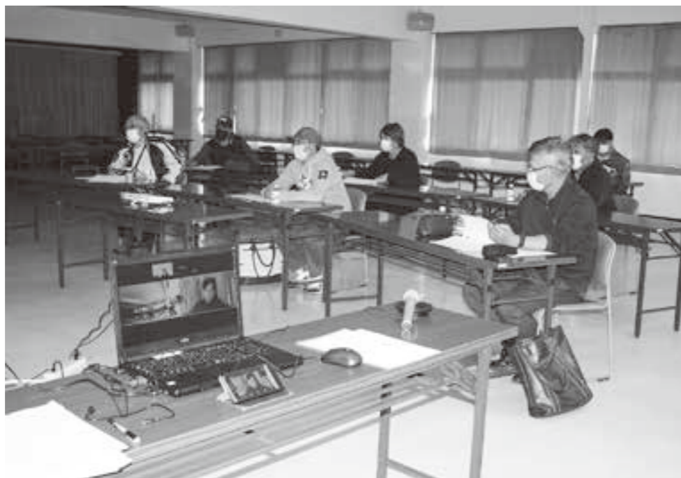
一日農業バイト「デイワーク」利用説明会

方法の他、経営者としての心構え等について講演をして頂きました。いずれの講演も参加者からは「次回も開催して欲しい」という意見を頂き、短い時間でしたが、とても有意義な時間となりました。