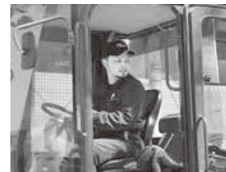
お父さんの広光さん

このコーナーでは組合員の子ども達を紹介し、今頑張っている事や心に残る思い出、将来の夢、農業を営むお父さんとお母さんへのメッセージ等を写真を交えて紹介し、農業を頑張るお父さん・お母さん方にエールを送るコーナーです。