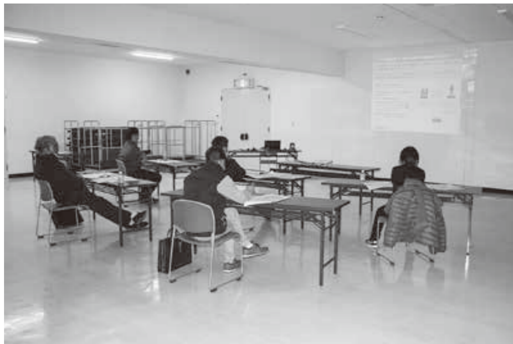
畑作・酪農従業員雇用者研修会

3月28日、畑作・酪農従業員雇用者研修会（8名（うち3名W E B）参加）を、3月31日には1日農業バイト「デイワーク」利用説明会（8名（うち2名W E B）参加）をそれぞれ開催しま