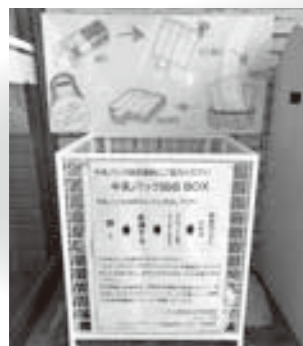
Aコープ鹿追店 正面入り口東側