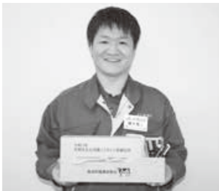
12万トン突破を記念して酪農家全戸に記念品が配られました

当JAでは令和3年の年間(1月~12月)出荷乳量が12万トンを突破しました。本来であれば鹿追町酪農振興会主催による記念事業を実施する予定でしたが、新型コロナウイルス感染症拡大防止の観点から中止し、記念品の配布のみ行われました。