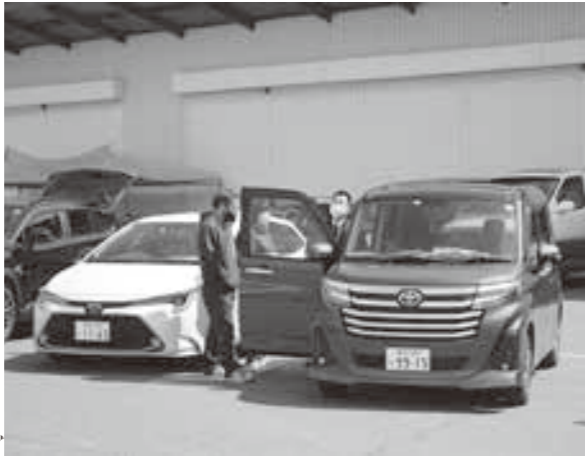
新車や中古車が数多く並びました。