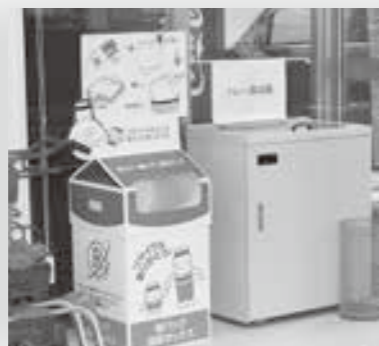
瓜幕店 正面入り口のトレー回収箱の隣