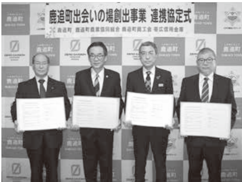
協定を結んだJA木幡組合長、喜井町長、八木帯広信金常務理事、石田商工会会長(左から)

3月31日、鹿追町役場において、「鹿追町出会いの場創出事業」の連携に関する協定式が行われ、帯広信用金庫と鹿追町、鹿追町商工会、当JAの4者が協定を締結しました。 この事業は、鹿追町の後継者対策及び少子化対策として、出会いの場の少ない独身男女に対し出会いの場を提供し、結婚後の鹿追町への定住を図ると共に地域の活性化を推進する事を目的としています。 今後は4者で連携を図りながら帯広信用金庫が運営する結婚相談所「おびしんキューピット」を推進し、未婚の農業後継者等に対するパートナーづくり支援を行って参ります。