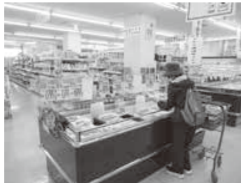
「とがち鹿追牛」を買い求めるお客様

新型コロナウイルス感染症の影響もあり大きなイベントが中止されている中、多くの皆様に「とがち鹿追牛」をご賞味頂くため企画しましたが、当日はあいにくの肌寒い天候にもかかわらず、開始直後から多くのお客様の来店があり、冷蔵ケースに並べた鹿追牛が次々と売れ、人気部位は早々に完売する盛況ぶりとなりました。また、ローズステーキは注文を受け焼いて販売もしましたが、お昼時には