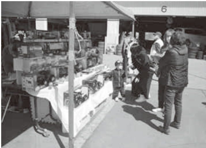
子ども連れの家族の姿も多く見られました。

タイヤコーナーでは、夏タイヤを特別価格で販売し、ご成約頂いた方には成約記念品として、オイル交換