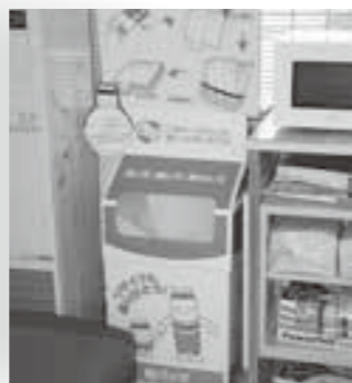
東瓜幕店 事務所窓口の向かい