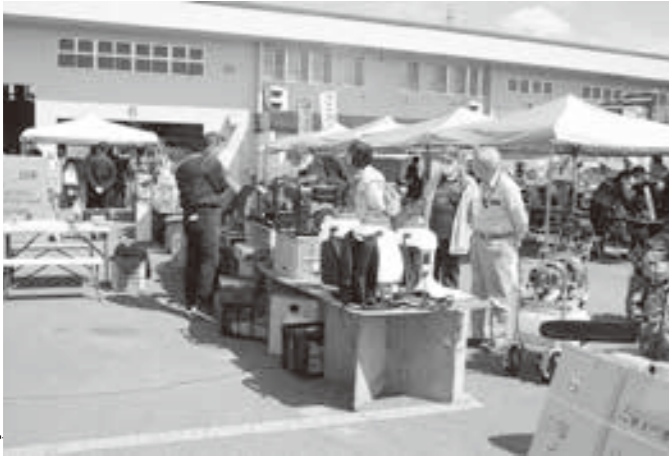
多くのお客様に会場頂きました。

「第19回春のJA整備工場フェア」を4月16日(土) 10時より、花火を合図に開催しました。当日は天候にも恵まれ、開店時間前よりチラシに掲載されたAコープ特価商品をお客様で溢れ、多くの方々にお買い上げを頂きました。また、恒例の