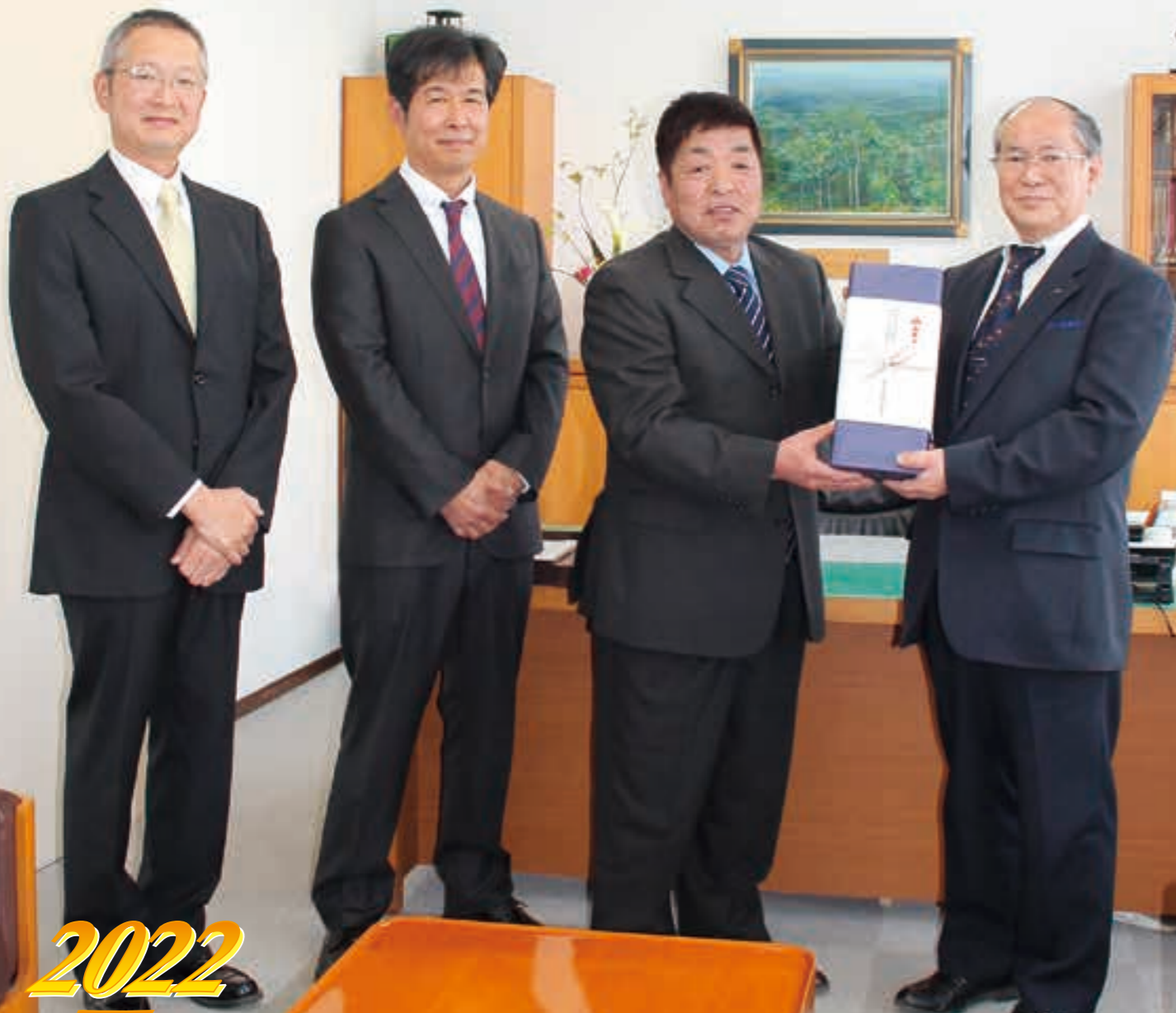
木幡JA組合長(右)へ記念品を贈呈する 鹿追町酪農振興会役員の方々の皆さん