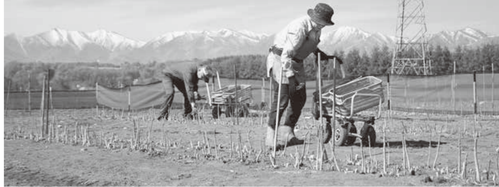
一本一本手作業で収穫される鹿追産グリーンアスパラガス

今年のグリーンアスパラガスの収穫は、4月の平均気温が高かった事から平年より9日早い4月26日より始まりました。