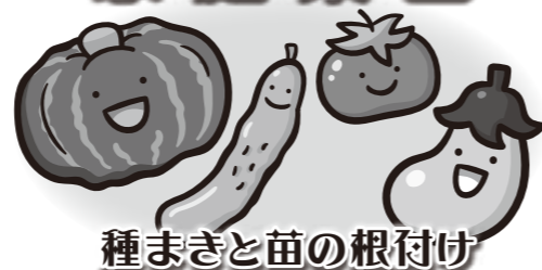
すじまきに種をまく