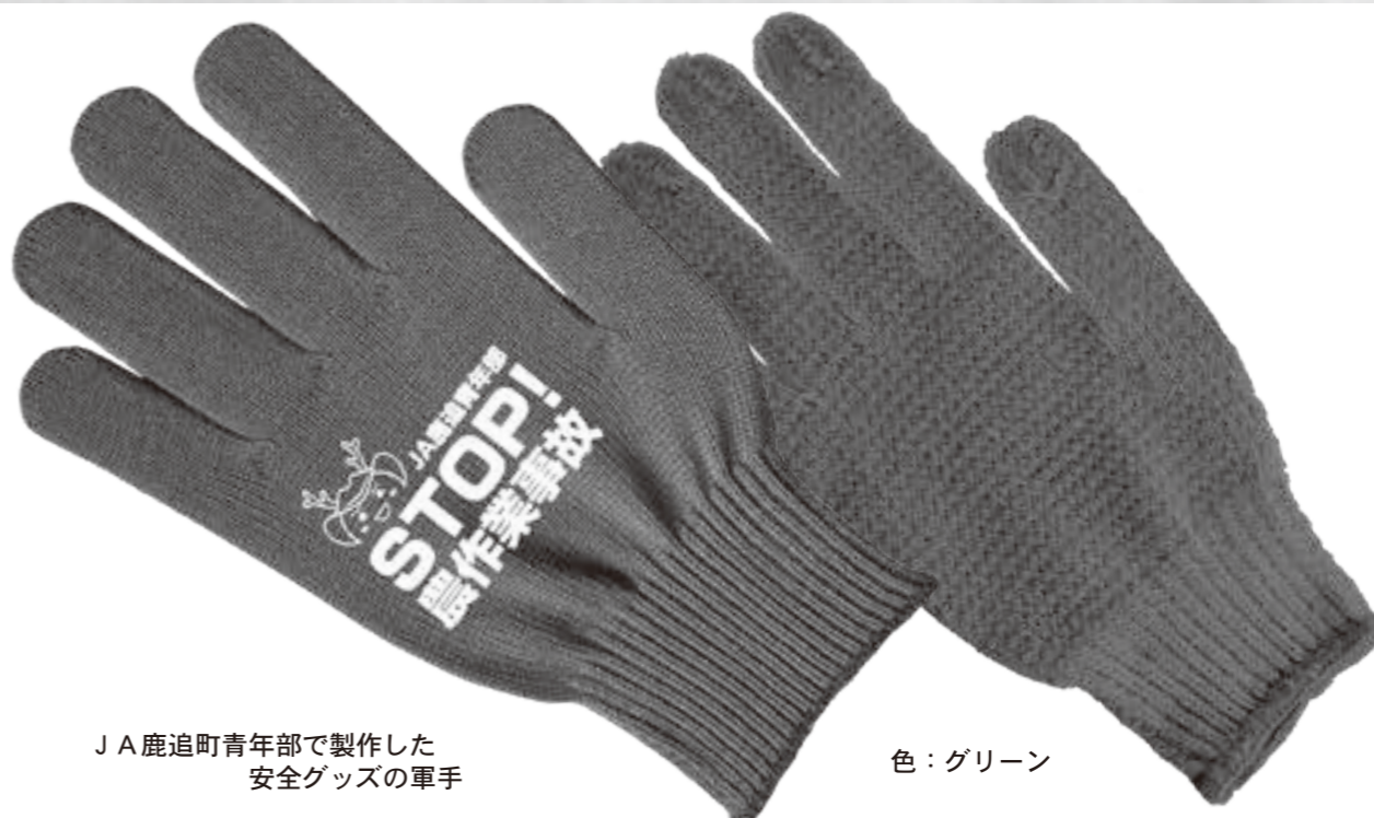
J A鹿追町青年部で製作した安全グッズの軍手

今年度は、『STOP! 農作業事故』とプリントした軍手を製作しましたので、常に安全意識を持って農作業に従事しましょう。