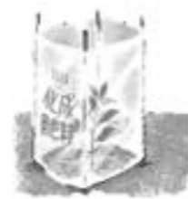
肥料袋等で風よけをする