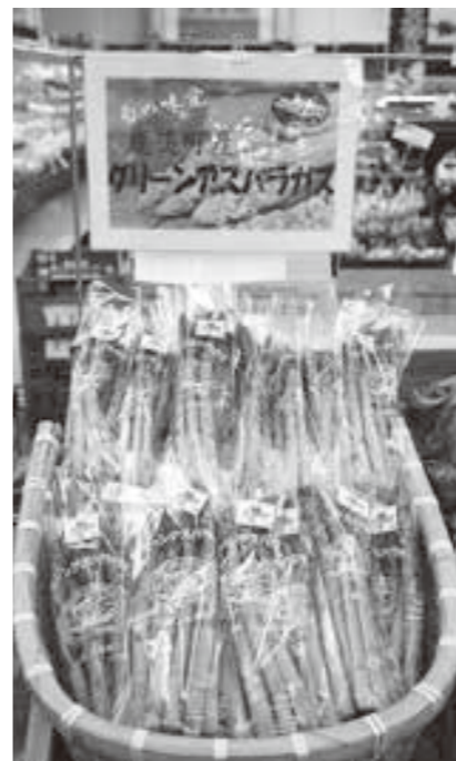
Aコープ鹿追店で販売されています。

町内の酪農家や畜産農家から供給された堆肥等の有機質を豊富に含んだ畑で栽培されたグリーンアスパラガスは、「甘さ」と「柔らかい食感」が特徴的です。量販店やギフトとして全国