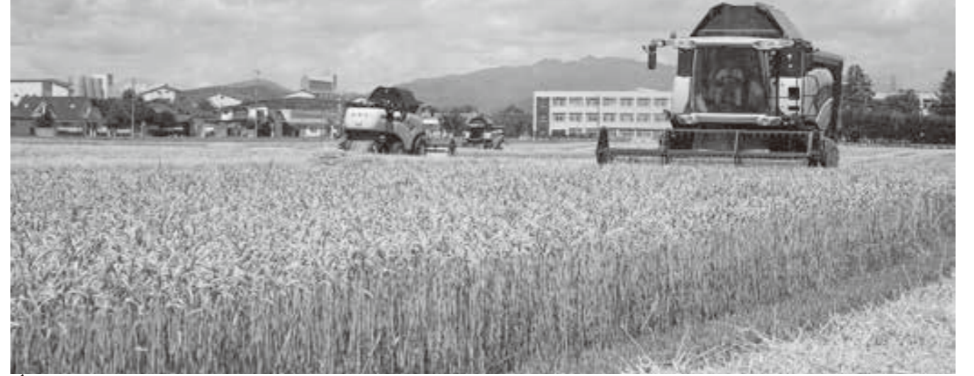
生産者の適切な肥培管理により平年並みの収量となった小麦

7月21日より開始した令和4年産小麦の収穫・受入作業が、8月1日に終了しました。