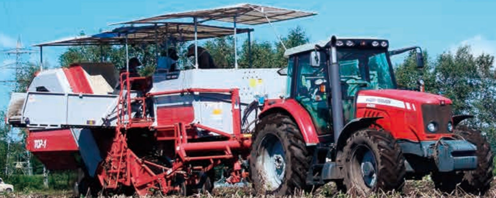
上然別 上重 翔吾農場