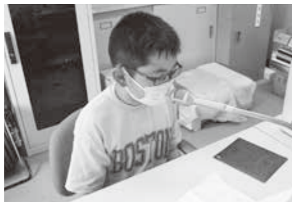
「農作業安全標語」を一文ずつ丁寧に、ハキハキした声で読み上げる児童達

この防災無線は、鹿追町役場、鹿追小学校に協力を頂きながら毎年実施しており、今年で6年目を迎えます。