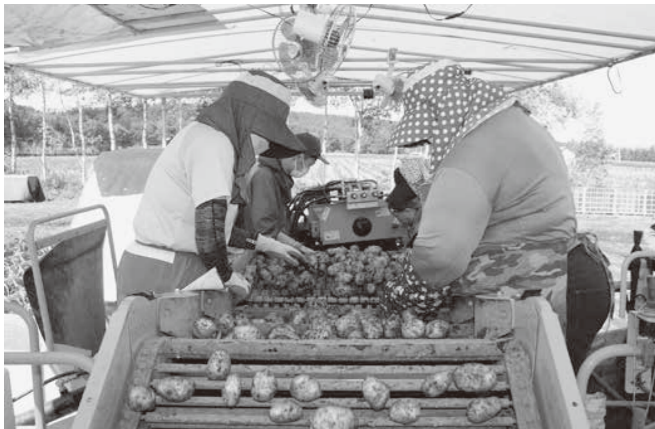
最盛期を迎えた馬鈴しょ収穫作業

生産者の方には、安全作業に努めて頂くと共に町民の皆様におかれましては、各種農産物を輸送する大型車輛や収穫を行う大型機械が道路を走行しますので、通勤・通学等の際は各車輛にご注意頂くと共に、ご理解賜りますようお願い申し上げます。