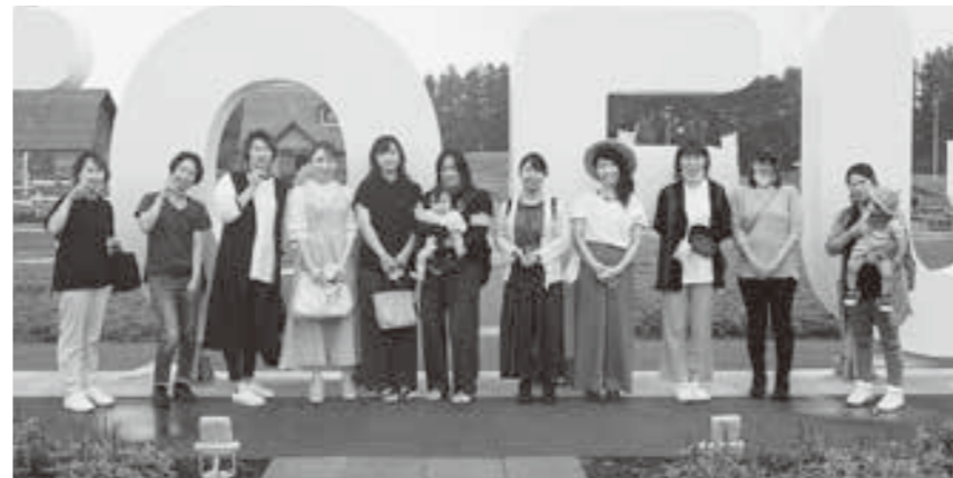
『OTOFUKE』モニュメントの前でパチリ☆