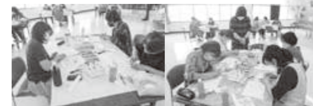
削ったパステルを指につけて描いていきます

今回は決められた題材で型を使って描いていきましたが、桜が上手く形にならなかつたり悪戦苦闘しながらも、自分の好きな色を使い、個性豊かな作品が出来あがりました。