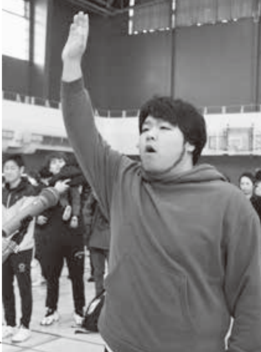
選手宣誓をする若原青年部長