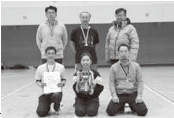
シニアの部 優勝 通明チーム