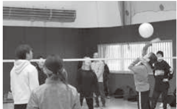
鋭いスパイクがコートに刺さりました