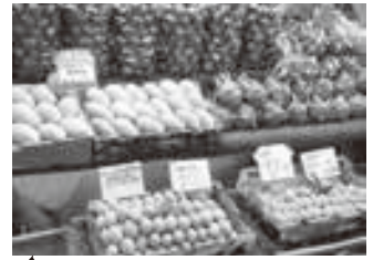
オートコー市場で販売されていた果物