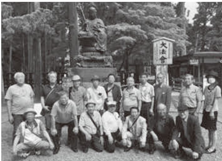
今後も個性豊かな方たちと楽しみながら思い出を作っていきたいです。

を通じ、すごく楽しく感じています。地区の老人会にも名を連ねていますが行事等に参加できていないのが現状です。趣味が魚釣り、読書、旅行等の為、毎年春はカレイ、秋はコマイ、冬はワカサギ等を狙いに出かけていますが、イワナやヤマメ等の溪流釣