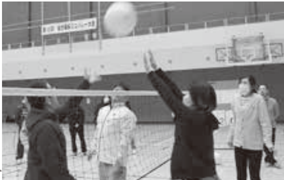
ネット際の攻防戦に会場からは歓声が上がりました