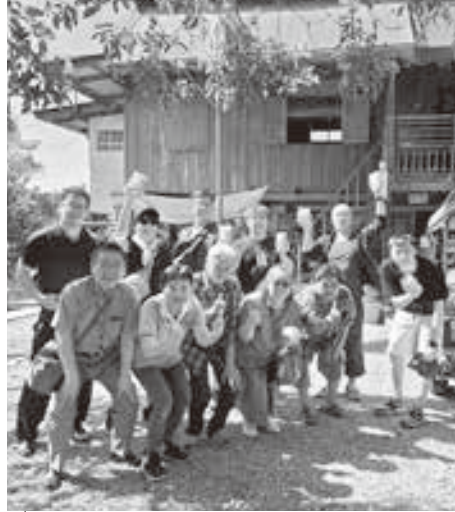
ティラデート果樹園にて記念写真

今回の研修では暁の寺(ワット・アールン)やメークロン鉄道市場等も見学し、日本国内では目にする事の出来ない建築物や国民の生活風景と貴重な体験を肌で感じ、有意義な研修となりました。また、研修以外にも夕食ではタイ料理やバンコク市内で鹿追町内出身者が経営する「PEKKO HOKKAIDO KITCHEN」で十勝産牛を堪能し、組合員同士の親睦もより一層深まり、これから始まる農作業に向けて英気を養う事が出来ました。