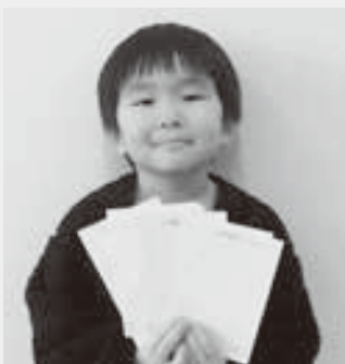
〈今月の抽選者は私です〉