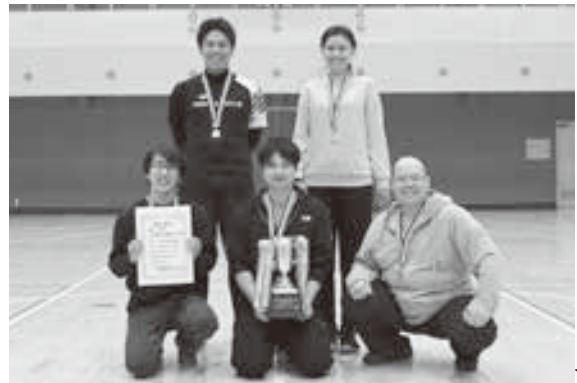
一般の部 優勝 北鹿追Aチーム