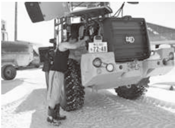
毎日オイルの点検は欠かせません！

○次代を担う農業青年にメッセージをお願いします。 人間誰でも失敗を経験して乗り越えるからこそ成長していくものです。失敗した時のリスクも考えつつ、常にチャレンジしてもらい、新しい風を吹かせていってほしいです。 ○消費者にメッセージをお願いします。 スーパー等で十勝産、鹿追町産の農畜産物を意識し、見つけた際には是非手に取って頂き、食べてもらえると大変有難いです。