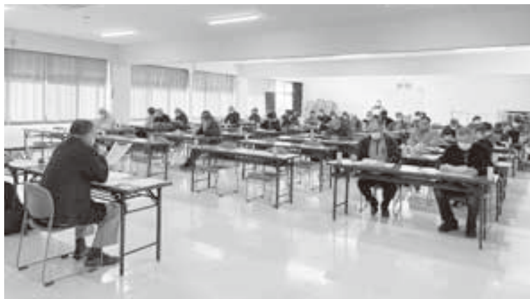
多くの方に参加頂きました

11月27日、鹿追町税対策委員会と合同により農業簿記記帳説明会を開催しました。(参加者40名) 説明会では、JA及び鹿追町税対策委員会から決算に向けての日程や留意点の他、今年10月から開始となった「インボイス制度」、そして翌年から改正となる「電子帳簿保存法」について説明がありました。 インボイス制度については具体例を参考に、適格請求書発行事業者から発行された請求書がインボイスの要件を満たしているかを確認し、理解を深めました。消費税の課税事業者(本則課税)が仕入控除を受ける為には、要件を満たした適格請求書等の保存が要件となりますので、ご注意ください。お店で商品を購入した際のレシートも適格請求書に該当しますので、保管をお願いします。 新たな電子帳簿保存の関係では、電子データでやり取りしたものが対象であり、紙でやり取りしたものをデータ化しなければなりません。今後新たな制度改正に対応する為、説明会等を開催していきますので多くの方の参加をお願いします。