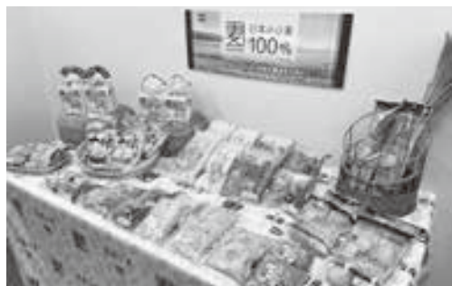
株敷島製パンの「日本の小麦100%」シリーズ

今回訪問させて頂いた取引 先からは、当JAの農畜産物 に対する期待が大きく、今回 の研修内容を今後の事業展開 に役立てて参ります。