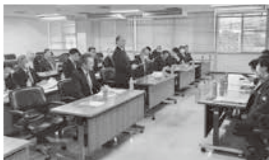
株エーコープ近畿本社にて

4年振りとなる当JAの役 員研修を11月20日から22日ま での日程で関西方面の取引先 を中心に実施しました。