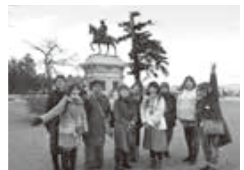
伊達政宗公銅像と