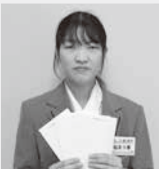
〈今月の抽選者は私です〉