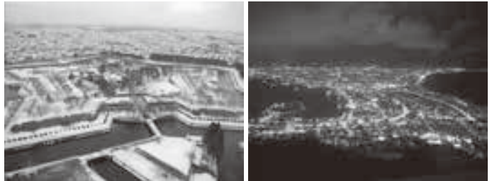
雪に覆われた五稜郭(左)と函館山からの夜景

1日目はJRで新得駅から函館駅へ移動、貸切バスに乗り五稜郭公園へと向かいました。五稜郭タワーに上り、雪に覆われた五稜郭や歴史が分かるジオラマを見学しました。次に夜景を見るために函館山へ。雪が降っていたこともあり少し不安ではありましたが、綺麗な夜景を見る事が出来、皆さんは何枚も写真を撮られていました。宿泊先である湯元啄木亭では、カニ等海産物メインの夕食を堪能し、1日目終了しました。