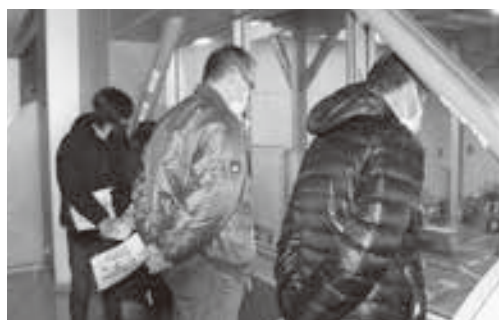
ゴミ搬入ステージを見る皆さん

12月13日に第2回農事組合長会議を開催し、会議終了後、くりりんセンターにおいて施設見学を実施しました。始めにくりりんセンターの規模と仕組みや、日々回収されるゴミがどのように処分されているかの一連の流れを映像を通して説明して頂きました。