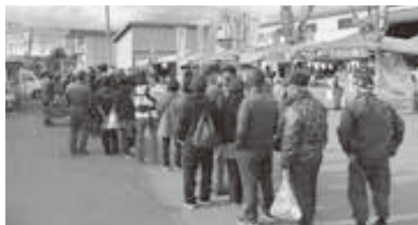
トイレットロールの整理券配布には長蛇の列が出来ました。