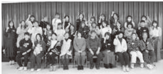
お気に入りの作品が出来ました！

11月14日、JA十勝地区女性協議会フレッシュミズ部会に所属しているJA十勝清水町・JAめむろ・JA新得町・当JAの4JAで、4年振りとなる交流会を行いました。