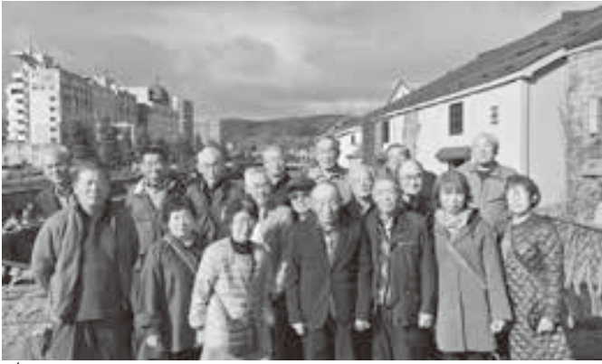
小樽運河での集合写真

今回は、これまで3年間新型コロナウイルス感染症により中止とされていました。4年振りに例年より規模を縮小し、道内「白老・登別・定山溪の旅」という事で出発しました。