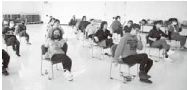
音楽に合わせて運動！

最後は、ゆっくりとした動作でヨガを行い、今回の三部合同講習会は終了となりました。