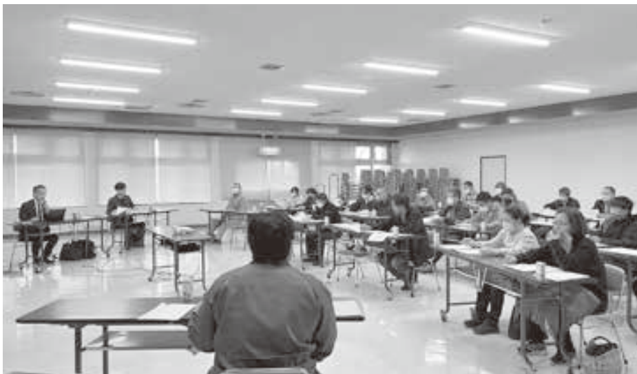
経営者や女性農業者等多くの方に参加頂きました。

インボイス制度については問い合わせの多い疑問点等、制度が始まってからならではの説明があり、参加者は話に聞き入っていました。また、電子帳簿の保存の関係ではイ