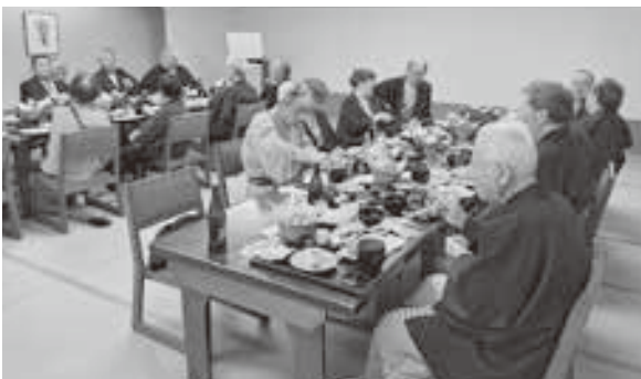
会食時は終始会話が途切れない状況でした

最終日は、千歳「サケのふるさと千歳水族館」にて多くの淡水魚を中心とした淡水生物を観察しましたが、特に管内唯一のほ乳類、特定外来生物の「アメリカミンク」にみなさん目を引かれていた様子でした。また、水族館に併設している道の駅では、多くの観光客がいる中、お土産を購入されている方もいました。水族館を出発後は恵庭へ向かい、温泉旅行最後の食事となる「釜飯いちえ」にて昼