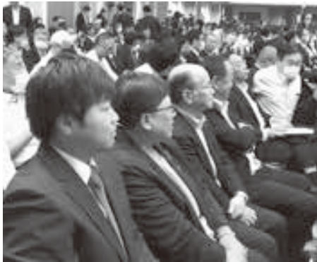
全道から多くの農業関係者が出席しました。

最後にこの実践フォーラムを通じ、今後も大会決議事項の実践に取り組み、達成に繋げることを確認しフォーラムが終了しました。