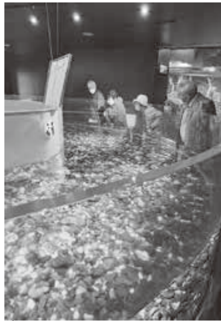
多くの淡水魚を観察した「サケのふるさと千歳水族館」

二日目は、「わかさいも本舗 洞爺湖本店」にて各自ご家族・友人等へのお土産を購入されたのち、昼食会場となる小樽へ向かいました。到着後、観光客で賑わう小樽運河「浅草橋」で集合写真を撮り、「北海あぶりやき運河倉庫」にて海産物の網焼きやジンギスカンを堪能しました。昼食後はかまぼこで有名な「かまぼこ」に立ち寄り、その後の自由時間では、みなさんそれぞれショッピング等を楽しみました。小樽を散策後、宿泊地「定山溪万世閣ホテルミリオナー」へ向かい、到着後は前日同様、温泉に浸かりゆつくりと過ごして頂き、夕食を堪能しました。