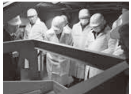
様々な機械の役割について説明を受けました

11月15日から1泊2日の日程で、会員12名の参加により道内研修会を実施しました。