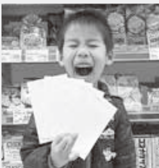
〈今月の抽選者は私です〉