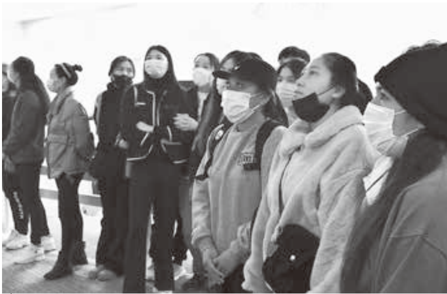
製造ラインの映像を真剣に見る技能実習生達

11月9日、外国人技能実習生の日帰り研修が実施され、よつ葉乳業(株)十勝主管工場を見学しました。技能実習生17名は技能修得に向け日々実習に励んでいます。酪農実習の現場で生産された生乳が製品として加工から出荷されるまでの過程を研修し、実習生