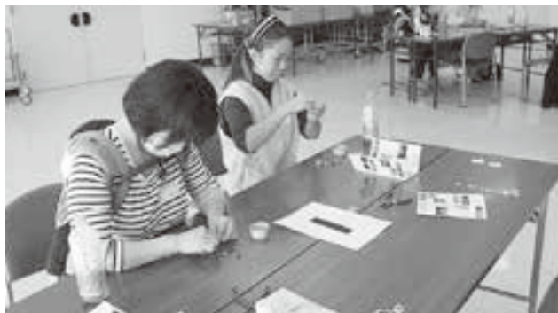
選んだパーツを通していきます