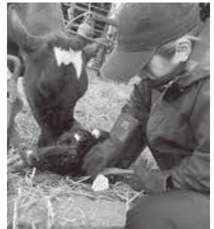
生後間もない仔牛に、耳標の取り付け作業