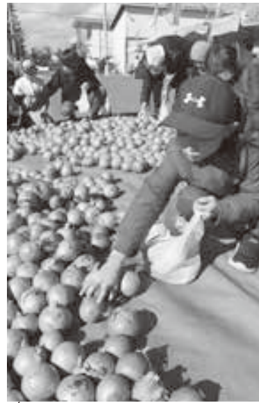
玉ねぎ詰め放題は、10時の花火を合図に沢山のお客様で賑わい大盛況でした。